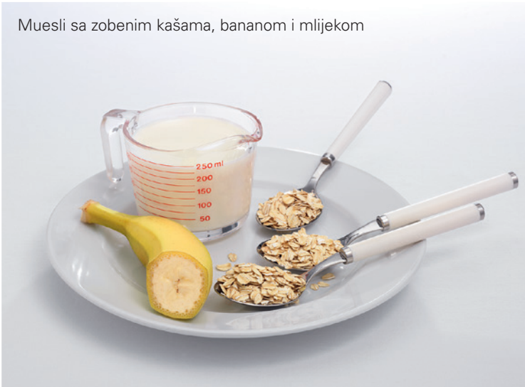
Muesli sa zobenim kašama, bananom i mlijekom