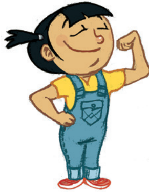
... ምምዕባል ጥንካረን ሜላን