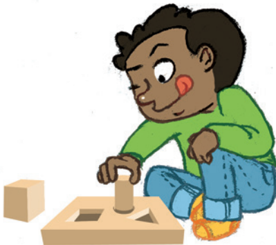
... ምስታፍ ኣብ ዘይኩለፍ ጸወታ