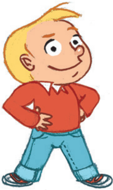
... ምህናጽ ርክሰ-ተካማንነተይ