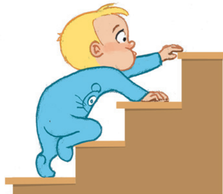
... ምምሃር ደረት ፃቕመይን ምውጋድ መጉዳክትን