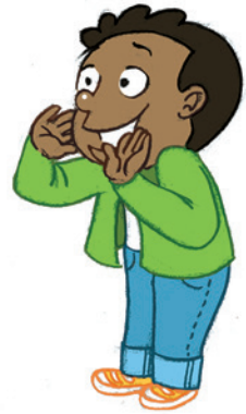
... ምግላጽ ገዛክ ርክሰይ